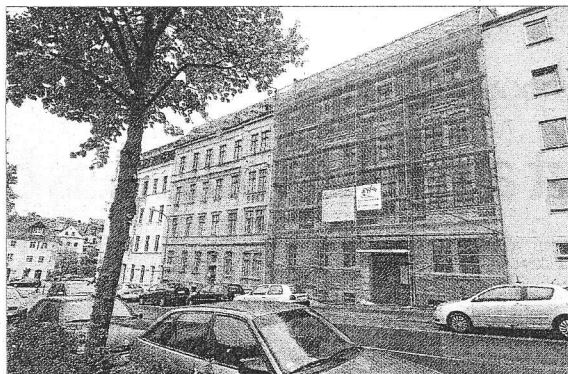
So sieht das Gebäude Hugo-Keller-Straße 5 von außen aus.

Trotzdem muss es von Grund auf saniert werden. Die Gerüste wur-